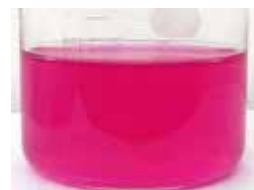
レッドドラゴンフルーツ ピューレ粉末 500 mg を 水100mlに溶解した時の画像